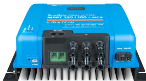
Controlador de carga solar MPPT 150/100-MC4 Sin pantalla