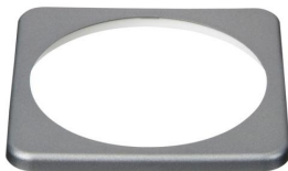
Embellecedor cuadrado BMV

Le recomendamos nuestro Battery Balancer (BMS012201000) para maximizar la vida útil de las baterías conectadas en serie.