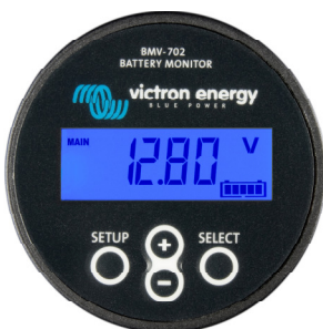
BMV 702S Negro